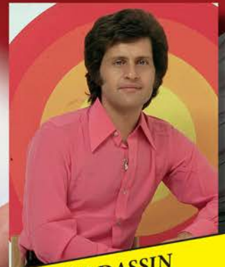
JOE DASSIN 46 ans déjà !