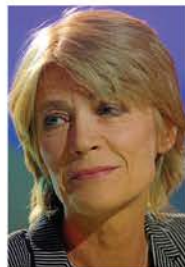
Françoise HARDY 80 ans