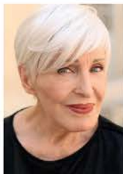
Nicole CROISILLE 88 ans