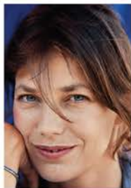
Jane BIRKIN 76 ans