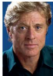
Robert REDFORD 89 ans