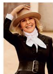
Diane KEATON 79 ans