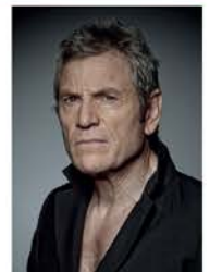
Tchéky KARYO 72 ans