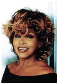
Tina TURNER 83 ans