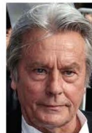
Alain DELON 88 ans